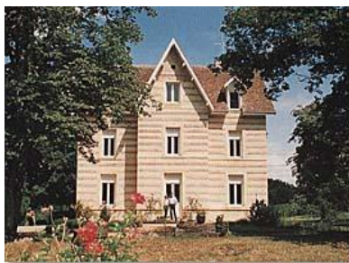
Le Château de la Mallevieille, ancien relais de poste

Château de la Mallevieille (parcourir 200 m sur la D 20 à gauche), propriété viticole proposant la dégustation de ses vins A.O.C. Bergerac et Montravel.