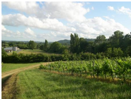
Vue sur la plaine de la Dordogne et sur le village du Fleix.

Revenir vers le chemin DFCI Le Fleix et descendre jusque dans le vallon – 1 km.